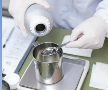
各種化粧品 原料調合