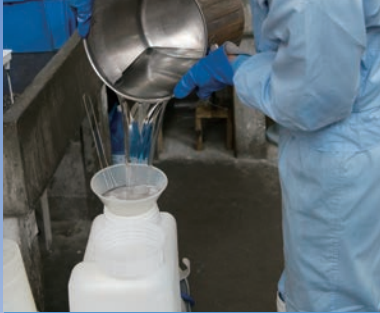
石けん素地 (植物性油脂を使用)

製法にこだわり、熱を加えず低温で作るため 有効成分を壊すことなく、そのまま閉じ込めることができます。