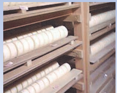
自然乾燥庫で 熟成