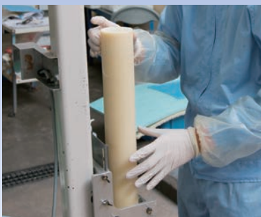
筒状の型から丁寧に 型抜き