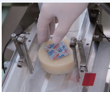
梱包も全て 手作業