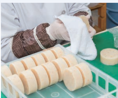
一つ一つ丁寧に 磨き