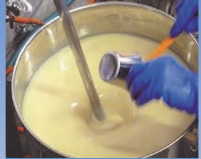
タイミングをみて 原料を注入