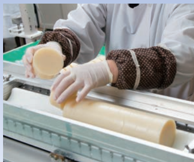
手作業による 切断